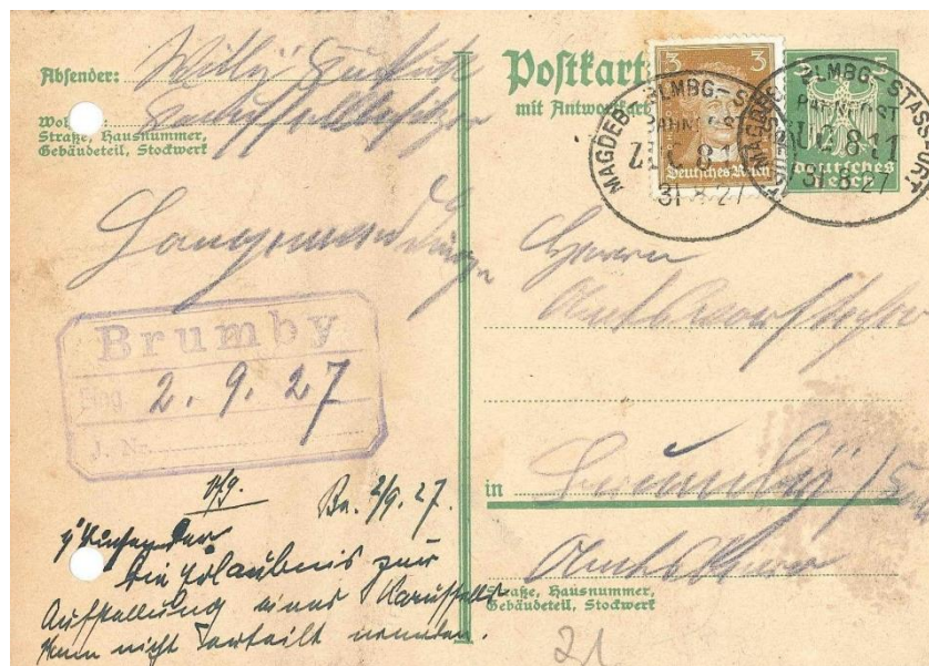
Auch möglich – Beantragung per Post, hier fünf Tage vor Aufstellung eines Karussells